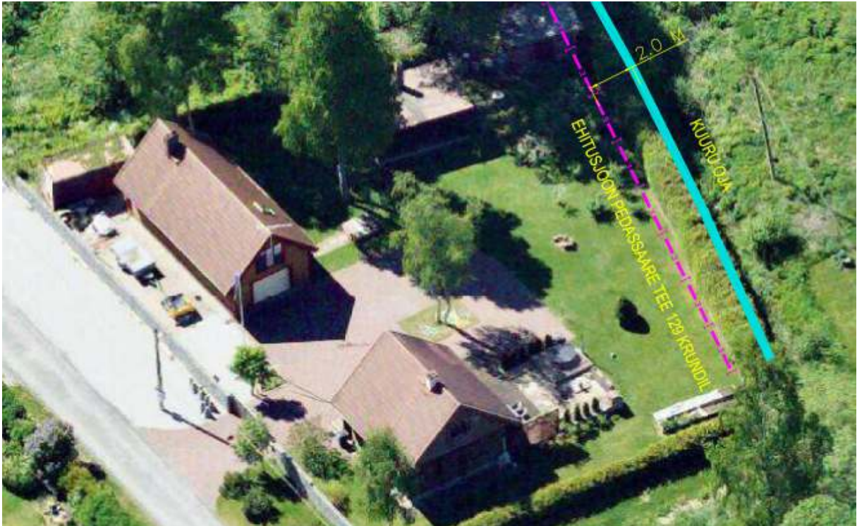
Joonis 2. Hoonete paiknemine naaberkrundil (Pedassaare tee 129)