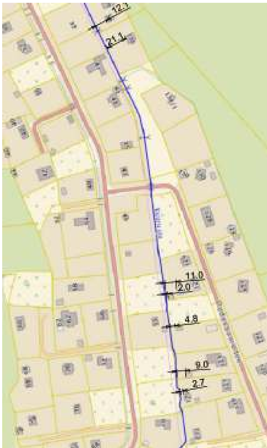
Joonis 1. Kontaktvööndi väljakujunenud ehitusjoone analüüs