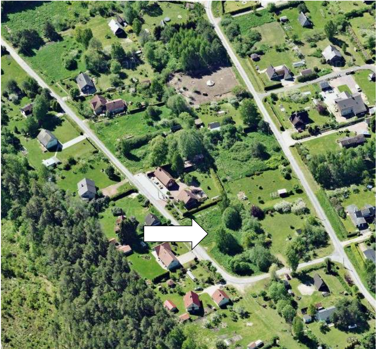
Foto 1 Vaade planeeritavale krundile põhjast.

Situatsiooniskeem on kajastatud joonisel 1. Olemasolev olukord on detailplaneeringu graafilises osas joonis 2 (Olemasolev olukord).